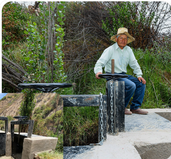
Nueva compuerta en Lluta

Agricultores de Lluta optimizan distribución de agua con instalación de infraestructura de riego, que impacta positivamente en su productividad.