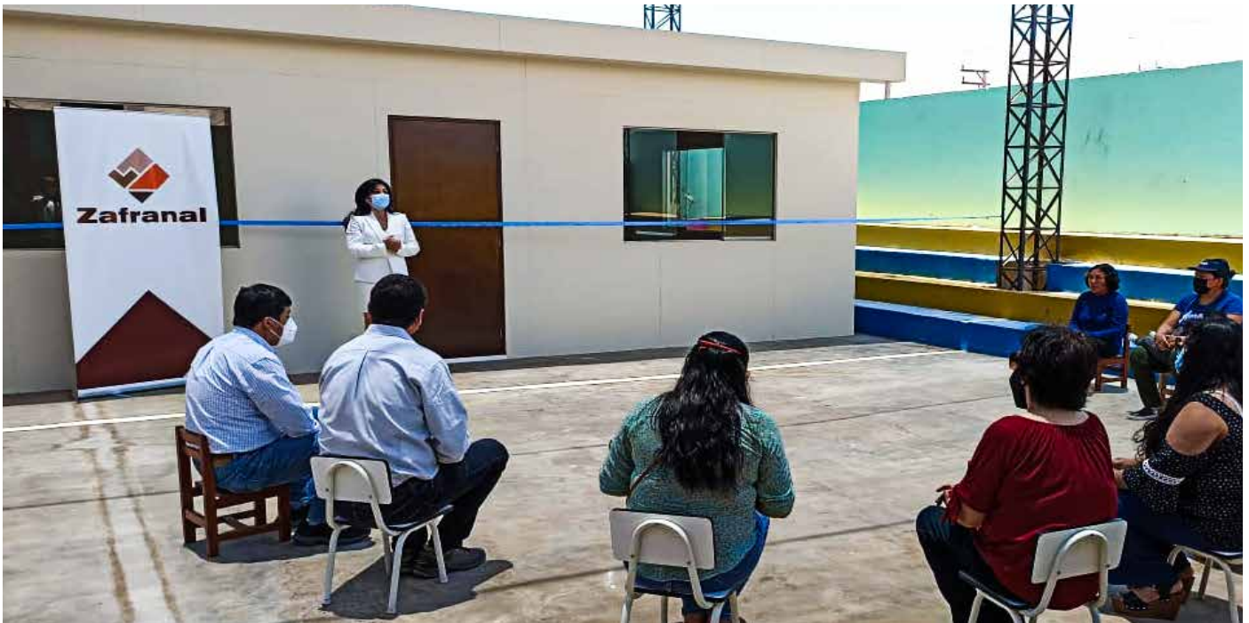
► Palabras de la plana docente, agradeciendo el apoyo que reciben del proyecto Zafranal.

Compañía Minera Zafranal implementa aula en la Institución Educativa Nuestra Señora del Rosario de Huancarqui.