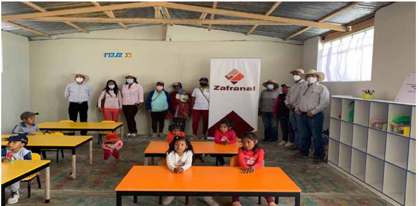
▶ Niñas y niños estrenando el mobiliario escolar, entregado por el proyecto Zafranal.

Para facilitar retorno a clases presenciales