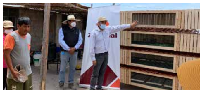
▶ Trabajadores de Zafranal mostrando las características de los módulos.