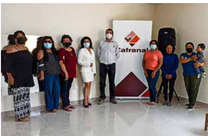
► Docentes, madres de familia y trabajadores del proyecto Zafranal juntos para la foto.

La directora del colegio y las madres de familia agradecieron por todo el apoyo que vienen recibiendo de Zafranal, indicando que la empresa está comprometida con la educación de los niños e indicaron que sus hijos contarán con una infraestructura moderna donde puedan desarrollar sus actividades psicomotrices.