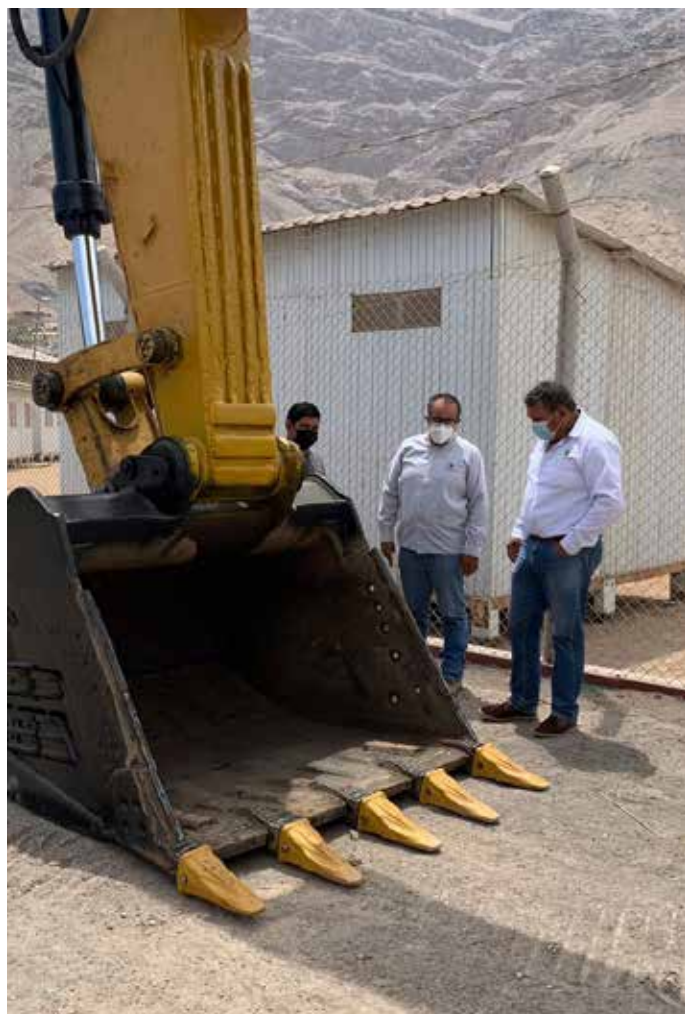
► Representantes de la Municipalidad y del proyecto Zafranal, inspeccionan los trabajos realizados en la maquinaria.