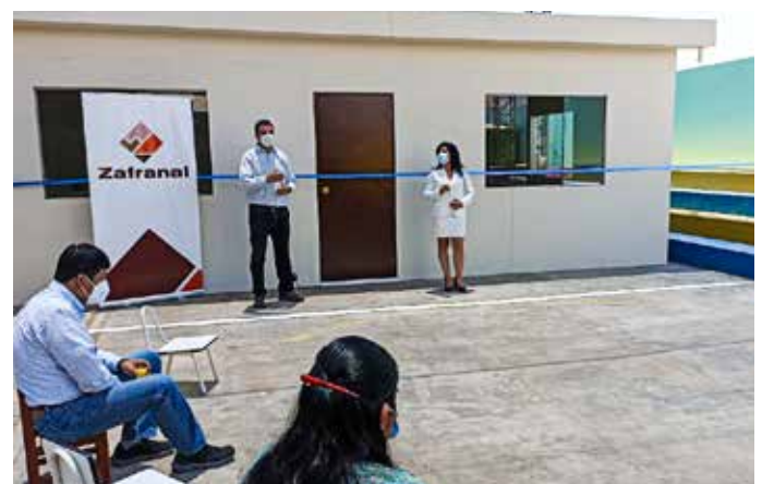
► Vista de la entrega del aula psicomotriz