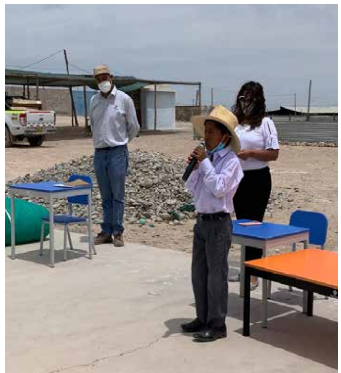
▶ Alumno declama durante la entrega del mobiliario escolar.

La ceremonia de entrega se realizó en un ambiente festivo, y se fortalecieron los lazos interinstitucionales. Los alumnos hicieron gala de su talento, presentando diferentes biles típicos y declamaciones.