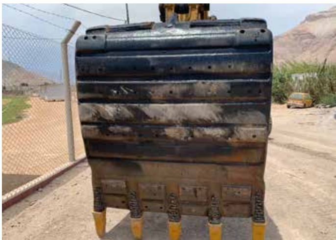
► Cuchara de la excavadora totalmente operativa.

El valle de Majes: Aplao, Huancarqui y Uraca, se beneficiarán gracias a la protección de la frontera agrícola.