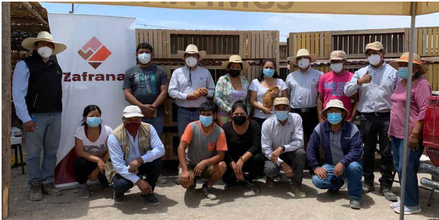
▶ Beneficiarios y representantes de Zafranal, junto a los módulos para cuyes.

Productores de cuyes de Majes El Pedregal fortalecen sus capacidades